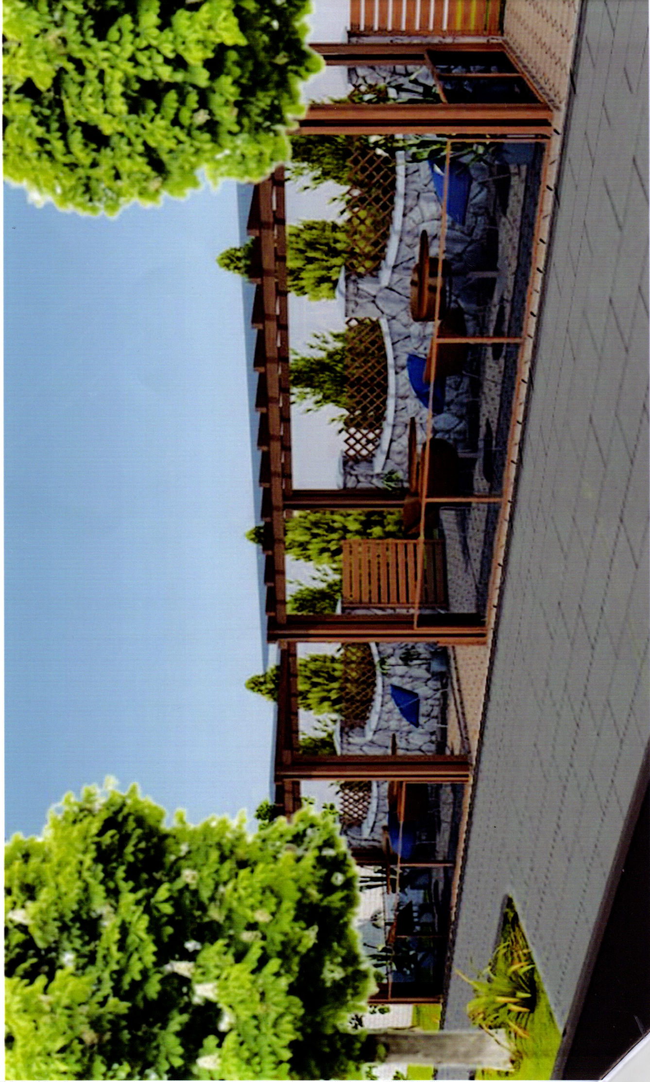
м. Малин вул. Грушевського, 27-2